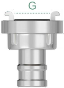
Liaison de tuyau Storz