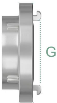
Storz rosca hembra