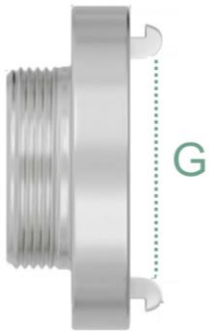
Storz rosca macho